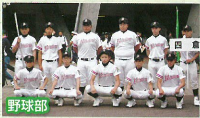
野球部 「全力疾走」「最大発声」「笑顔」「感謝」野球部員である前に四倉高校生であれ！自覚と誇りを胸に目指すは甲子園！ 顧問 三浦 勲/南館 孝栄