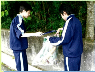
全校清掃ボランティア