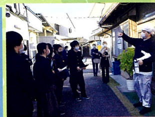
いわき“職”体験ツアー