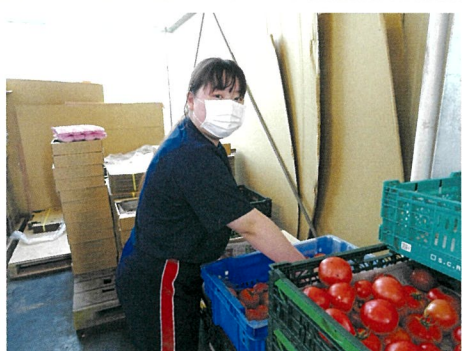
デュアル実習風景 ①