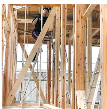
デュアル実習風景 ②