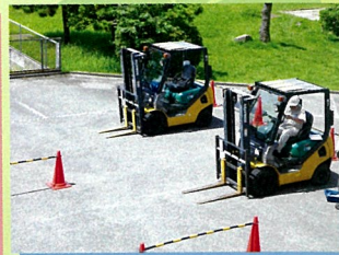
フォークリフト運転特別講習