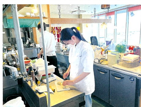
デュアル実習風景 ③